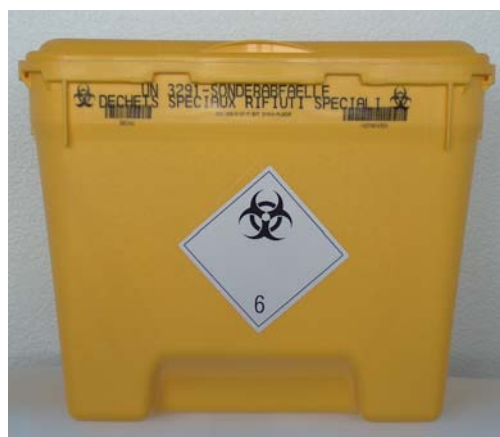
Sicherheitsbehälter 30 L, Artikel-Nr. 600021 CHF 9.60

Voraussetzung • Der Kundendienst holt bei Ihnen regelmässig Untersuchungsmaterial ab • Ausschliesslich der untenstehende Sicherheitsbehälter inkl. Entsorgungsvignette wird durch Viollier transportiert